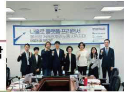
[단독] 평균 14.6%... 비싼 수수료에 우는 온라인플랫폼 노동자들